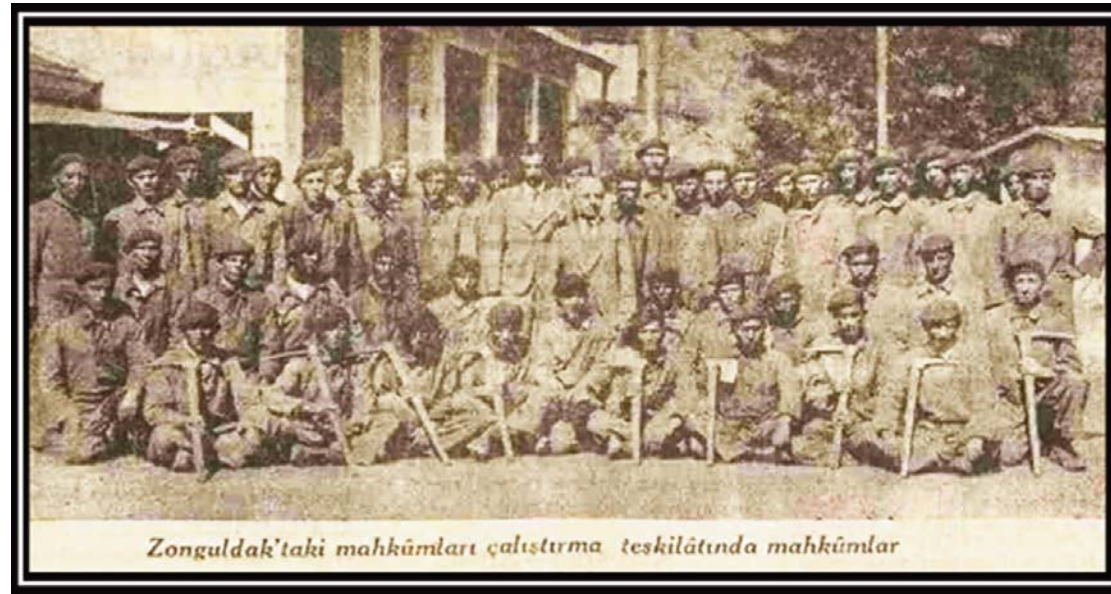
Zonguldak'taki mahkûmları çalıştırma teskilatında mahkûmlar

uydurma bir iş de değildir. Biz hiçbir ülkenin sorununu çözümlerken aldığı önlemleri olduğu gibi almadık. Hepsinin tarihini biliyoruz. Cahili değiliz. Bu bizimdir, kimseden almadık, bizden alınlar!"