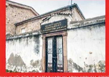
AYVALIK KÜLTÜR VE TABİAT VARLIKLARINI KORUMA GİRİŞİMİ

CUMHURİYET İLKOKULU PARSELİ BKVKKB KARARI İLE 1.GRUP KÜLTÜR VARLIĞI OLARAK TESCİLLENDİ.