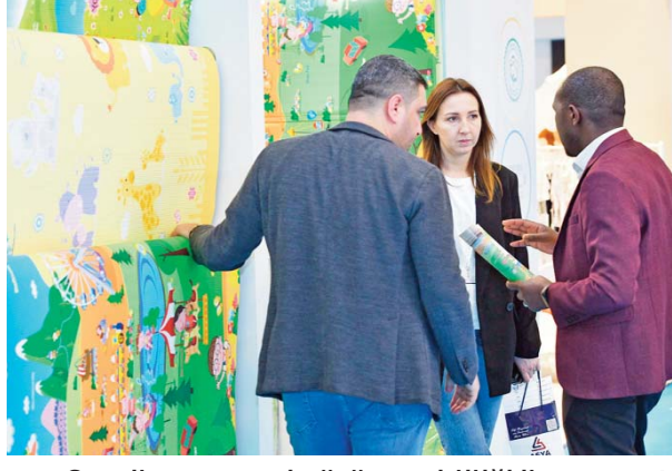
Sergilenen zengin ürün çeşitliliği ile sektörün bölgesindeki en önemli ticaret adresi olan fuar, ortalama

Aralarında İzmir firmalarının da olduğu yurt içi ve yurt dışından 1.000'in üzerinde marka, yeni tasarımlarını CBME Türkiye fuarında vitrine çıkarmaya hazırlanıyor. 11 - 14 Aralık 2024 tarihlerinde İstanbul Fuar Merkezi'nde düzenlenecek CBME Türkiye, uluslararası alım heyetlerine ek olarak Asya, Avrupa, Afrika, BDT ülkeleri ve Ortadoğu gibi farklı bölgelerden büyük alıcılara da ev sahipliği yapacak. Katılımcılarına eşsiz ticaret fırsatları sunan fuarında yer alan İzmir firmaları, özellikle yurt dışından gelecek alıcılarla doğrudan B2B ticaret görüşmeleri yaparak, yeni pazarlara açılacak.