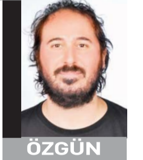
Maudie: Etrafı sanatla güzelleştirmek

Etrafı sanatla güzelleştirmek tartışmaya açık bir konu. Örneğin antik Yunan felsefesinde sanata karşı şüpheli görüşlerin olduğunu biliyoruz çünkü sanat, kimilerince, insanı hakikatten uzaklaştıran bir uğraş olarak yorumlanıyordu. Bunun yanında güzel kavramının öznel mi yoksa nesnel mi olduğu da felsefenin tartıştığı sorulardan bir tanesidir. Nesnel bir güzelliğin hayalini kurmak ve teorilerini geliştirmek de gayet masum ve yapıcı bir girişim. Bu tartışmaları şimdilik bir kenara bırakıp 2016 yılında çekilen, ressam Maud Dowley'in kişiliğine, zor ve artrit acılarıyla geçen hayatına, sanatına odaklanan Maudie filmine bakalım. Maud Dowley'in içinde bulunduğu kötücül çevreyi hem kişiliği hem de sanatıyla nasıl güzelleştirdiğini gözden geçirelim. Belki de bu, sanatın nesnel özellikler de taşıyabileceğinin bir örneğidir.