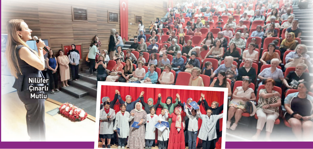
Editör: HAKAN SERBEST